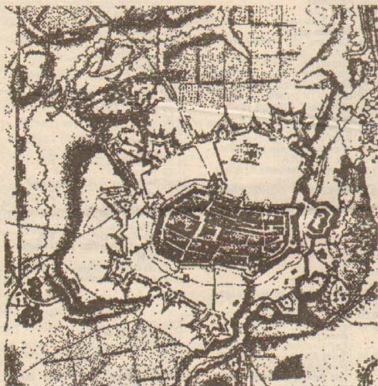
Plan twierdzy świdnickiej z 1762 roku