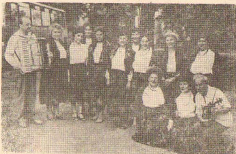
Zespół GOK w Słotwinie